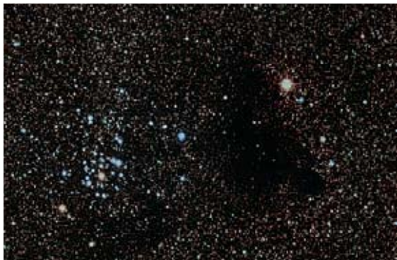
Figura 18.30 Problema de desafío 18.91.

luz y contiene unos 50 átomos de hidrógeno por \text{cm}^3 (hidrógeno monoatómico, no \text{H}_2 ) a una temperatura cercana a 20 \text{ K} . (Un año luz es la distancia que la luz viaja en el vacío en un año y es igual a 9.46 \times 10^{15} \text{ m} .) a ) Estime la trayectoria libre media de un átomo de hidrógeno en una nebulosa oscura. El radio de un átomo de hidrógeno es de 5.0 \times 10^{-11} \text{ m} . b ) Estime la rapidez eficaz de un átomo de hidrógeno y el tiempo libre medio (el tiempo medio entre choques para un átomo dado). Con base en este resultado, ¿cree que los choques atómicos, como los que dan pie a la formación de moléculas de \text{H}_2 , son muy importantes para determinar la composición de la nebulosa? c ) Estime la presión dentro de una nebulosa oscura. d ) Compare la rapidez eficaz de un átomo de hidrógeno con la rapidez de escape en la superficie de la nebulosa (si se supone esférica). Si el espacio que rodea a la nebulosa estuviera vacío, ¿sería estable una nube así, o tendería a evaporarse? e ) La estabilidad de las nebulosas oscuras se explica por la presencia de medio interestelar (MIE), un gas menos denso aún que permea el espacio y en el que están incrustadas las nebulosas oscuras. Demuestre que, para que las nebulosas oscuras estén en equilibrio con el MIE, el número de átomos por volumen N/V y la temperatura T de las nebulosas oscuras y el MIE deben estar relacionados por