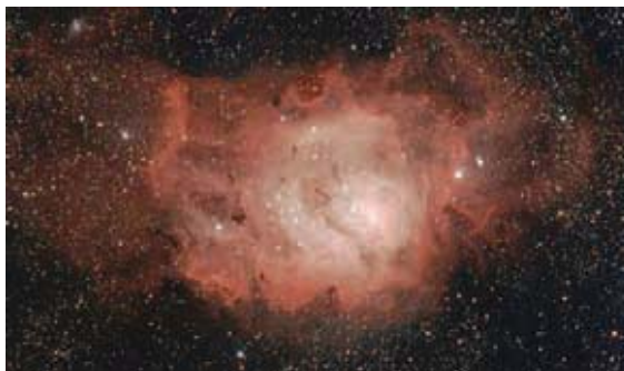
Figura 18.28 Ejercicio 18.25.

son sacudidas por turbulencia al viajar por nubes de gas como la nebulosa Laguna. ¿Le parece realista eso? ¿Por qué?